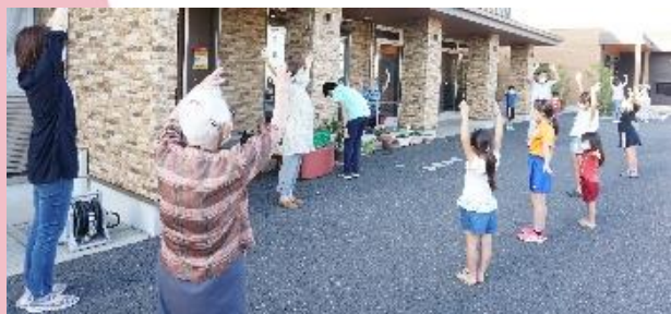
距離を保って楽しく体操をしています！